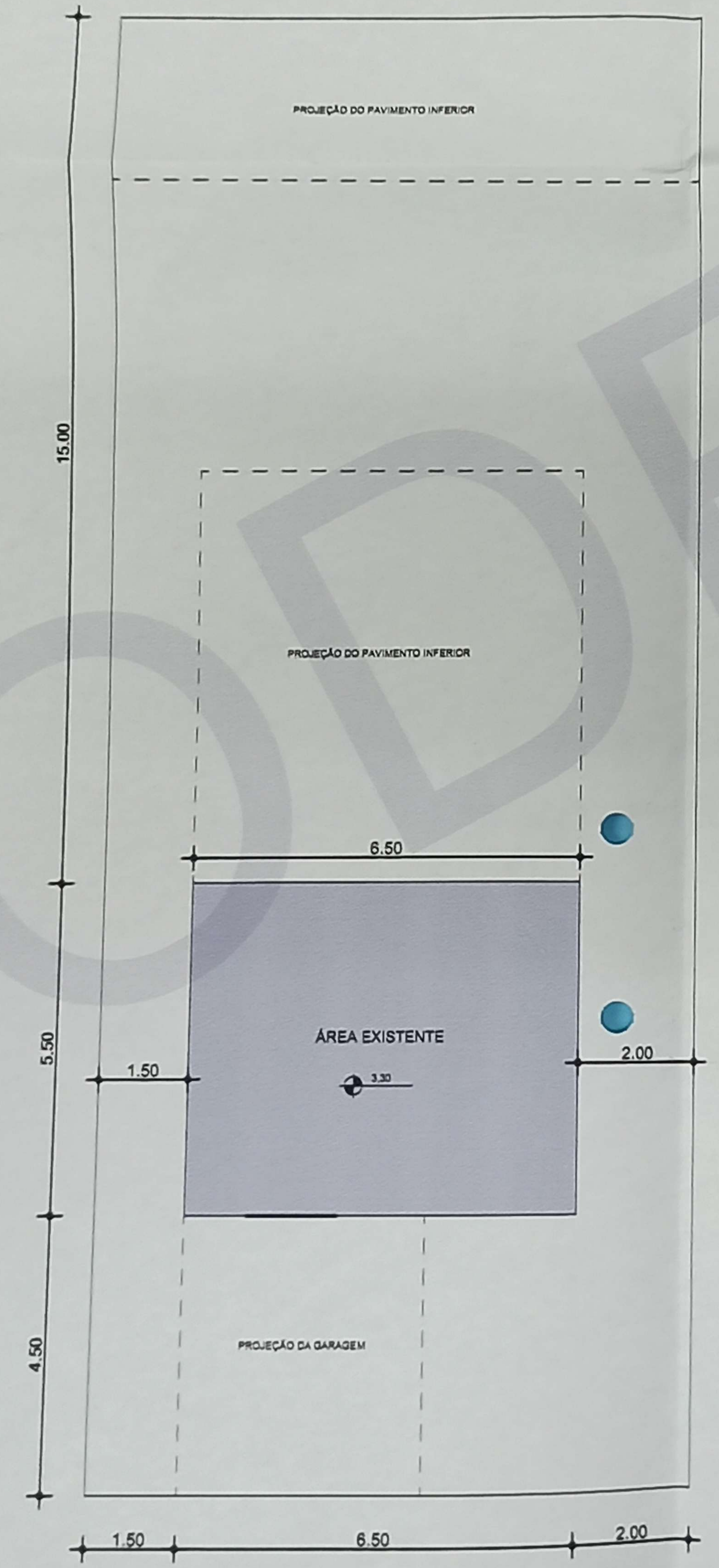
PAVIMENTO SUPERIOR ESC: 1:100