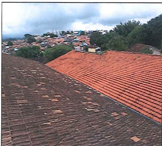
FOTO 01: VISTA DA COBERTURA NECESSITANDO SE SUBSTIUIÇÃO E ALINHAMENTO DE TELHAS. 21/03/2019 - 15:00