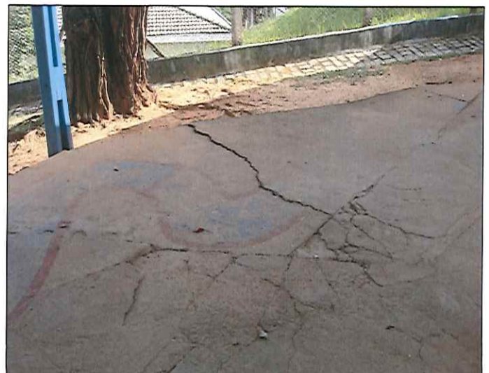
FOTO 08: VISTA DE PÁTIO DE ENTRADA NECESSITANDO MANUTENÇÃO. 24/04/2019 - 09:38