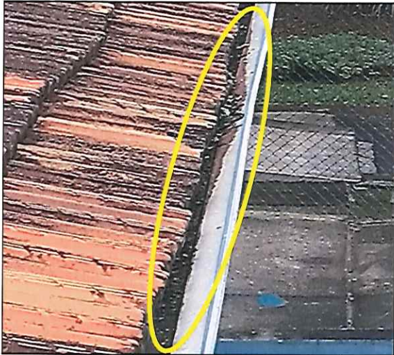
FOTO 05: VISTA DE TELHAS DESALINHADAS, NÃO HAVENDO A DISTÂNCIA NECESSÁRIA ENTRE TELHA E CALHA. 21/03/2019 - 14:56