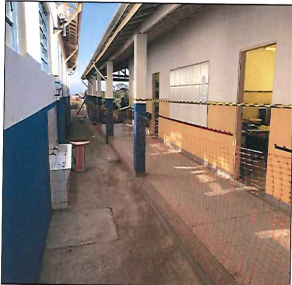
FOTO 11: VISTA DE PÁTIO ISOLADO DURANTE A EXECUÇÃO DOS SERVIÇOS. 09/08/2019 - 09:13