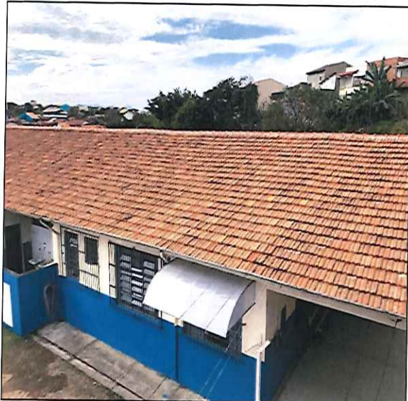
FOTO 15: VISTA DE SERVIÇOS DE COBERTURA FINALIZADOS. 29/08/2019 - 14:41