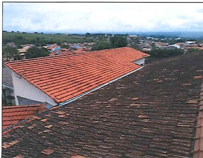
FOTO 04: VISTA DA COBERTURA NECESSITANDO SE SUBSTIUIÇÃO E ALINHAMENTO DE TELHAS. 21/03/2019 - 15:11