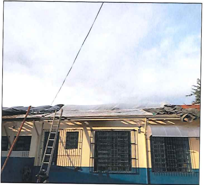
FOTO 10: VISTA DE COBERTURA DURANTE A EXECUÇÃO DO SERVIÇO. 05/08/2019 - 16:53