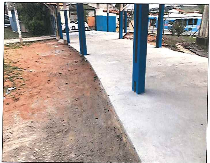
FOTO 16: VISTA DE PÁTIO DE ENTRADA FINALIZADO. 29/08/2019 - 14:38