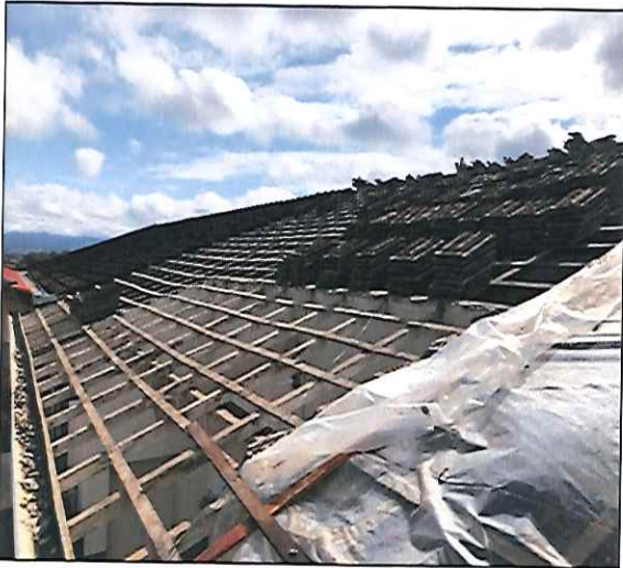
FOTO 09: VISTA DE COBERTURA DURANTE A EXECUÇÃO DO SERVIÇO. 05/08/2019 - 10:16