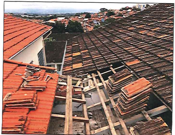
FOTO 12: VISTA DE PARTE DA COBERTURA ONDE HAVIA NECESSIDADE DE REDIMENSIONAMENTO DE CALHA. 06/08/2019 - 09:28