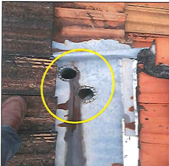
FOTO 07: VISTA DE TUBOS DE QUEDA NECESSITANDO DE REDIMENSIONAMENTO. 21/09/2019 - 14:57