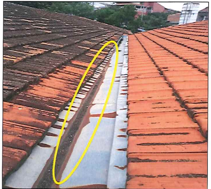
FOTO 06: VISTA DE CALHA METÁLICA EM PROCESSO DE OXIDAÇÃO. 21/03/2019 - 14:56