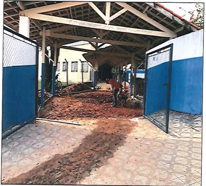
FOTO 14: VISTA DE PÁTIO DE ENTRADA DURANTE A EXECUÇÃO DO SERVIÇO. 13/08/2019 - 16:09