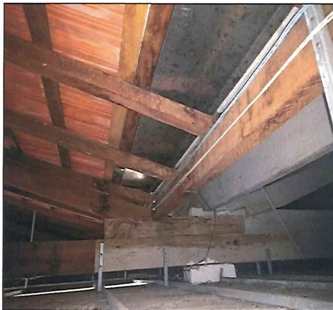
FOTO 02: VISTA DAS TESOURAS DO PÁTIO INTERNO. 21/03/2019 - 15:11