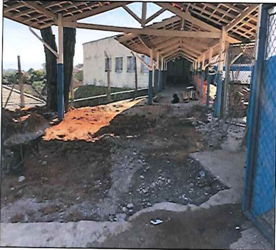
FOTO 13: VISTA DE PÁTIO DE ENTRADA DURANTE A EXECUÇÃO DO SERVIÇO. 12/08/2019 - 11:39