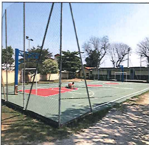
FOTO 11: VISTA DA QUADRA POLIESPORTIVA DURANTE A EXECUÇÃO DO SERVIÇO. 18/09/2019 - 10:37