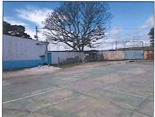
FOTO 04: VISTA DA QUADRA POLIESPORTIVA ANTES DA EXECUÇÃO DOS SERVIÇOS. 17/07/2019 - 12:23