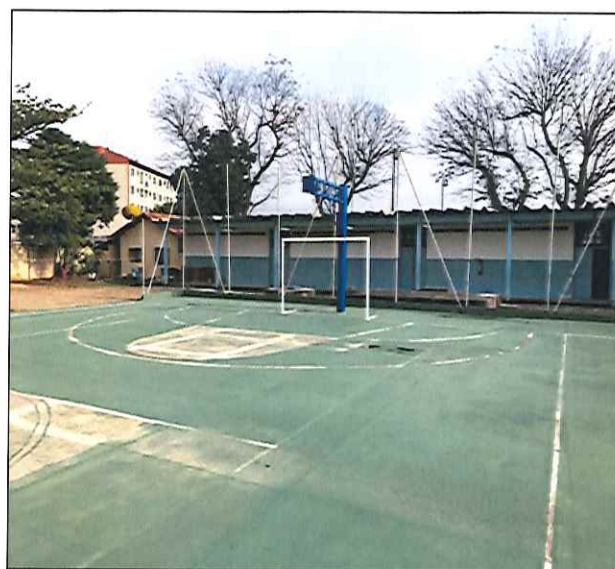
FOTO 10: VISTA DA QUADRA POLIESPORTIVA DURANTE A EXECUÇÃO DO SERVIÇO. 03/09/2019 - 08:28