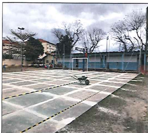
FOTO 09: VISTA DA QUADRA POLIESPORTIVA DURANTE A EXECUÇÃO DO SERVIÇO. 22/08/2019 - 13:26