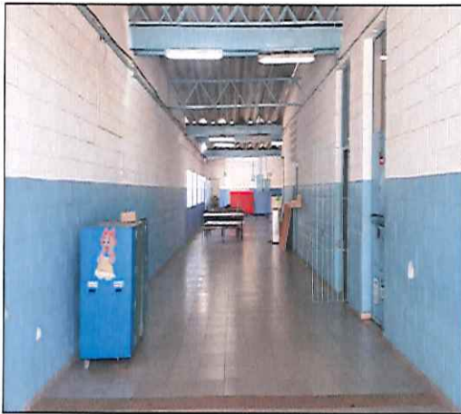
FOTO 01: VISTA DO REFEITORIO ANTES DA EXECUÇÃO DOS SERVIÇOS. 17/07/2019 - 12:04