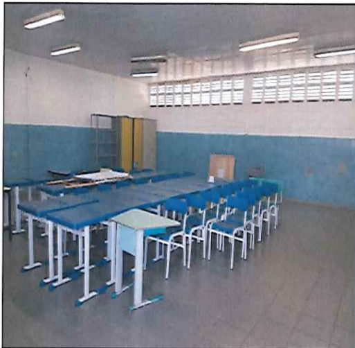
FOTO 03: VISTA DE SALA DE AULA ANTES DA EXECUÇÃO DOS SERVIÇOS. 17/07/2019 - 12:15