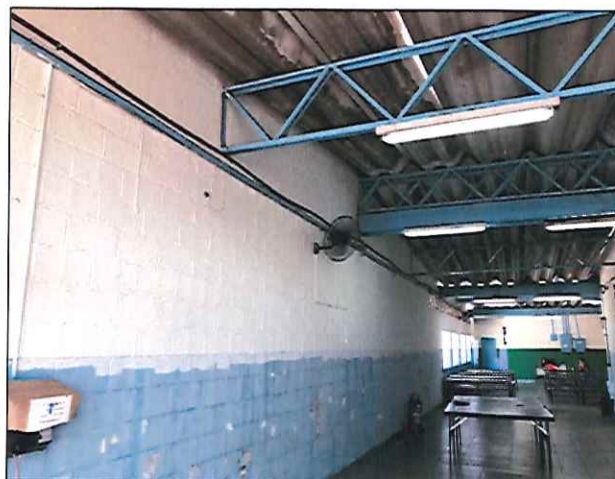
FOTO 12: VISTA DO REFEITÓRIO DURANTE A EXECUÇÃO DOS SERVIÇOS. 18/09/2019 - 10:40