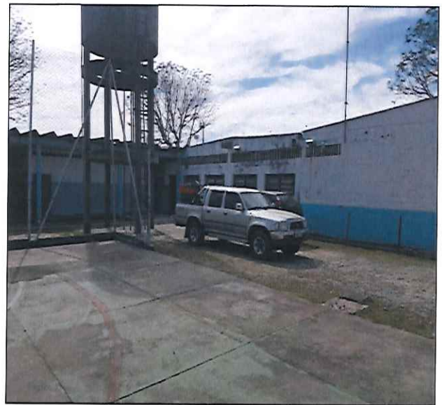
FOTO 06: VISTA DA CAIXA D'ÁGUA ANTES DA EXECUÇÃO DO SERVIÇO. 17/07/2019 - 12:23.