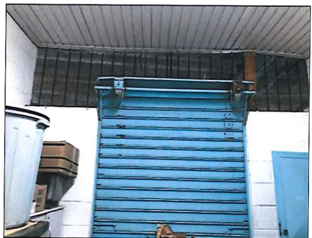
FOTO 08: VISTA DA COZINHA ANTES DA EXECUÇÃO DOS SERVIÇOS. 17/12/2019 - 16:42