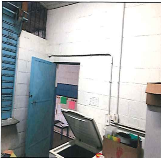
FOTO 07: VISTA DA COZINHA ANTES DA EXECUÇÃO DOS SERVIÇOS. 18/07/2019 - 16:42