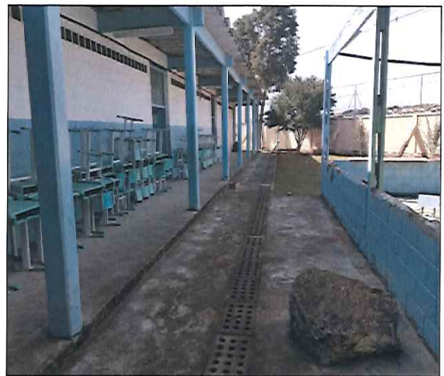
FOTO 02: VISTA DAS SALAS DE AULA DO LADO DIREITO DO PRÉDIO, ANTES DA EXECUÇÃO DOS SERVIÇOS. 17/07/2019 - 12:10